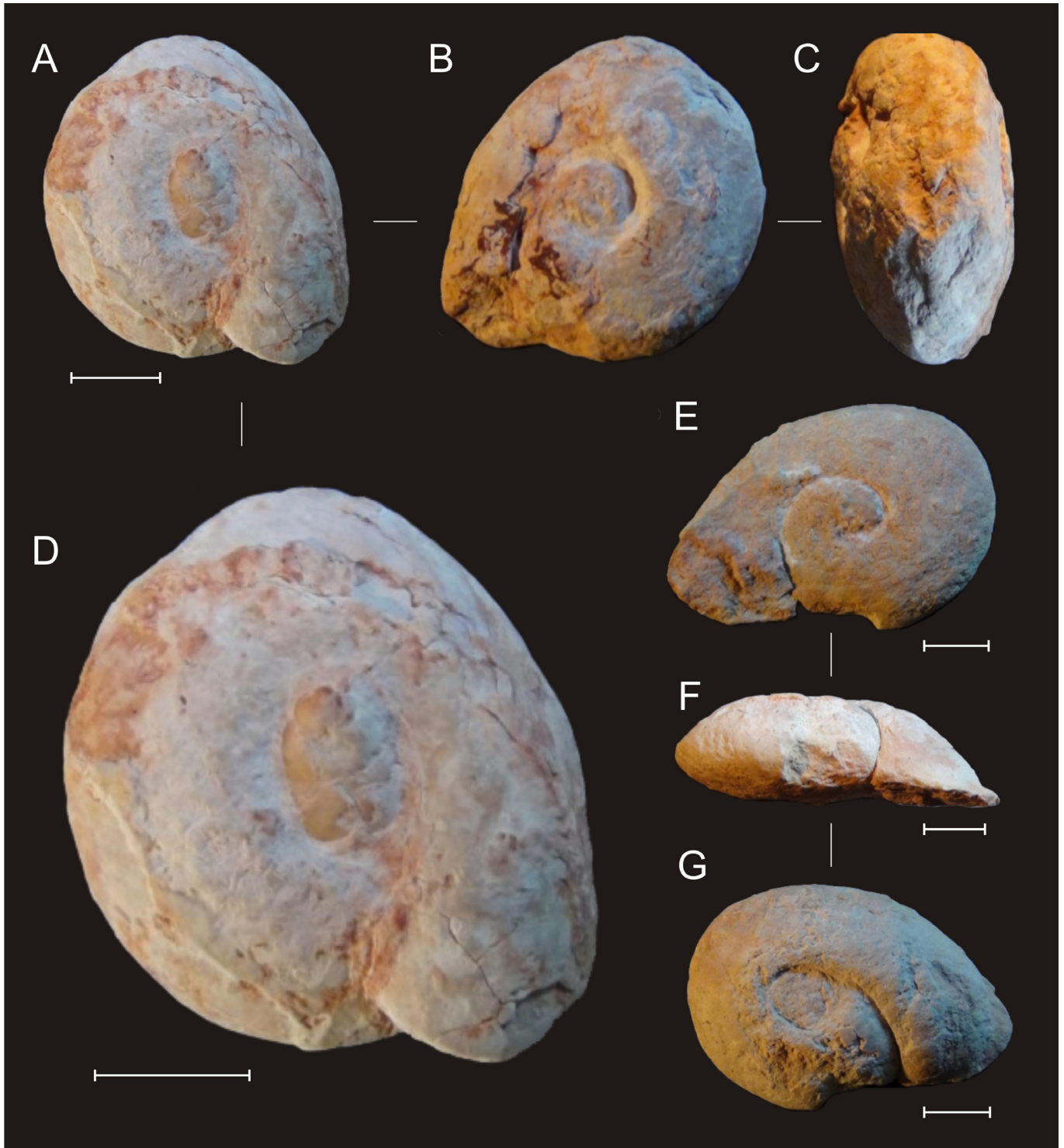
Planche 1. Lychnus provenant du Rognacien supérieur de Vitrolles, niveau 100 de la coupe A.

A–D. Lychnus siruguei nov.sp., holotype, MNHN.F.A59993 (Coll. Turin) ; A–C. Vues apicale, basale et abaperturale ; D. Grossissement de la vue apicale.