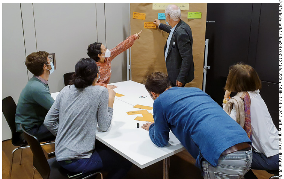
Abb 1 Diskussionen zur internationalen Waldpolitik am IDANE Wald+.

Im Dezember 2021 lancierte die Abteilung Wald des BAFU unter dem Titel «IDANE Wald+ Science-Policy Dialogue» eine erweiterte Diskussionsplattform zu internationalen waldpolitischen Themen mit einer spezifischen Stärkung durch Bei-