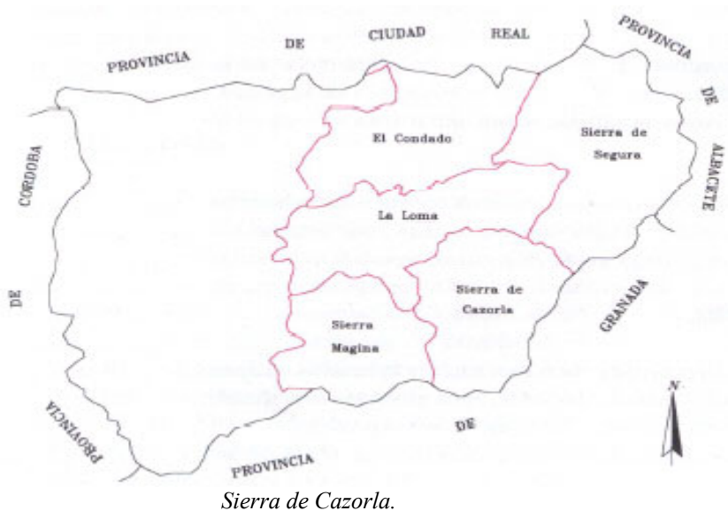
Figura 1. Situación geográfica de las comarcas de El Condado, La Loma, Sierra Mágina, Sierra de Segura y Sierra de Cazorla.

empujadas por los vientos que discurren por este corredor natural y descarguen en forma de lluvias abundantes, especialmente en primavera y otoño, en los bordes elevados de la depresión. Las precipitaciones oscilan, de esta forma, entre los 500 mm y los más de 1.000-1.200 mm en las cumbres.