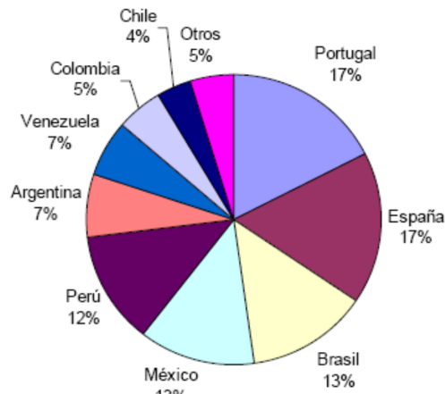
Tabla 2. Encuestas y países de procedencia (la figura adjunta detalla los respectivos porcentajes)