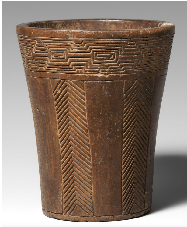
FIGURA 3. Anónimo (Perú), Qero Inca , ca. 1500, madera, altura 4\frac{5}{8} × diám. 4 pulg. (11.7 × 10.2 cm). Metropolitan Museum of Art, regalo de Nathan Cummings, 2004 (obra de arte en el dominio público)

tomes y lazos, que así llamamos los cuchillos nuestros para cazar aquel género de nuevas llamas, que así llamamos al ganado nuestro, y ellos lo decían por los caballos que nuevamente habían aparecido; y llevaban los tomes y cuchillos para los desollar y descuartizar, no haciendo caso de tan poco jente ni de lo que era; y como mi tío llegase al pueblo de Caxamarca con toda su gente... los españoles los recibieron... le dijeron, que venían por mandato del Viracocha a decirles como le han de conozer, y mi tío como les oyó lo que decían, atendió a ello y calló, y dio de beber a uno dellos de la manera que arriba dije, para ver si se lo derramaban como los otros dos. Fue de la misma manera, que ni lo bebieron ni hicieron