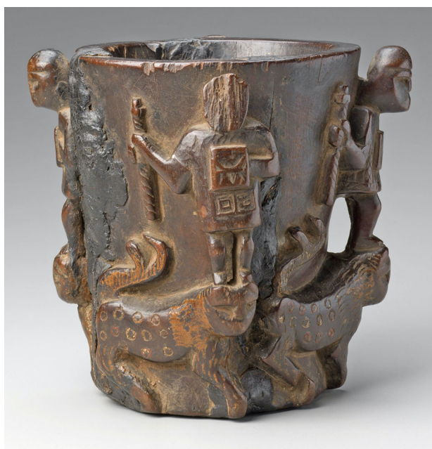
FIGURA 1. Anónimo, Qero Choquehuanca , ca. 1550, madera, altura 6 5/16 x diám. 6 pulg. (16 x 15.2 cm). Colección privada

Kubler escribe de manera prescriptiva en The Shape of Time , 8 y lo que hace analíticamente en sus estudios más específicos de arte precolombino y colonial.