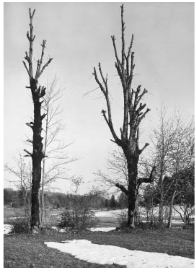
Abbildung 8: «Stark geschneitete Linde auf einer Privatweide» 1921 (Romont, H. Grossmann, Bildarchiv WSL).

Was sich schon im 19. Jahrhundert abgezeichnet hat, gilt für das 20. Jahrhundert erst recht: Die Laubfütterung fand kaum innerhalb des Waldes statt ( Abbildung 9 ). Im Tessin zog man die Schneitelbäume «in der Nähe der Gebäulichkeiten, längs Wegen und Wasserläufen und längs der Peripherie seines Eigentums, auf geringwertigen und versumpften Wiesen.» 169 In Uri standen die Schneitelbäume «gewöhnlich ein-