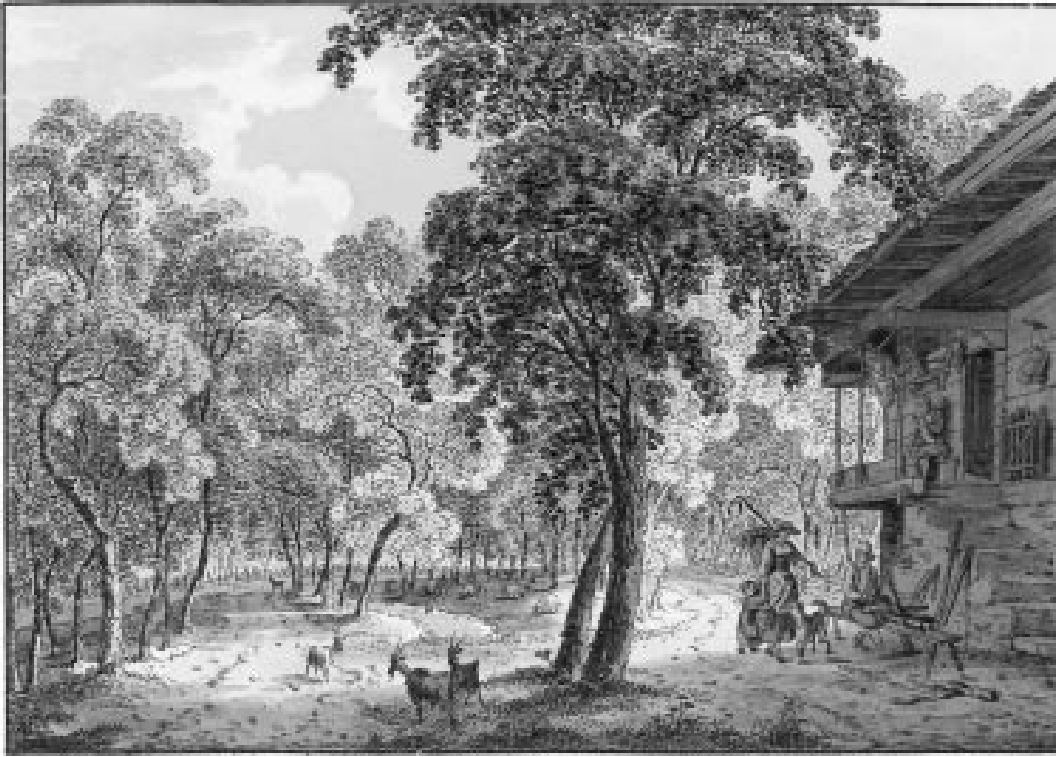
Abbildung 3: Ziegenweide in lichtem Wald 1808 (bei Bönigen, Franz Niklaus König, Umrissradierung koloriert, aus dem Album «Souvenirs des Environs d'Unterseen et d'Interlaken», Schweizerische Landesbibliothek Bern, Sammlung R. und A. Gugelmann).

populärwissenschaftlichen Buch «Schöner Wald in treuer Hand» zugunsten der Wytweiden sogar landschaftsästhetische Argumente. «Wir möchten die bestockten Weiden auch im Landschaftsbild nicht missen, denn sie geben diesem mit ihren tief beasteten Wettertannen oder dem lichten Grün ihrer Lärchen, mit dem Geläute weidender Herden und dem Spiel von Licht und Schatten, einen ganz besonderen Reiz.» 68 In dieser positiven Bewertung ist der Keim angelegt, dass sich diese Form von Waldweide bis heute gehalten hat.