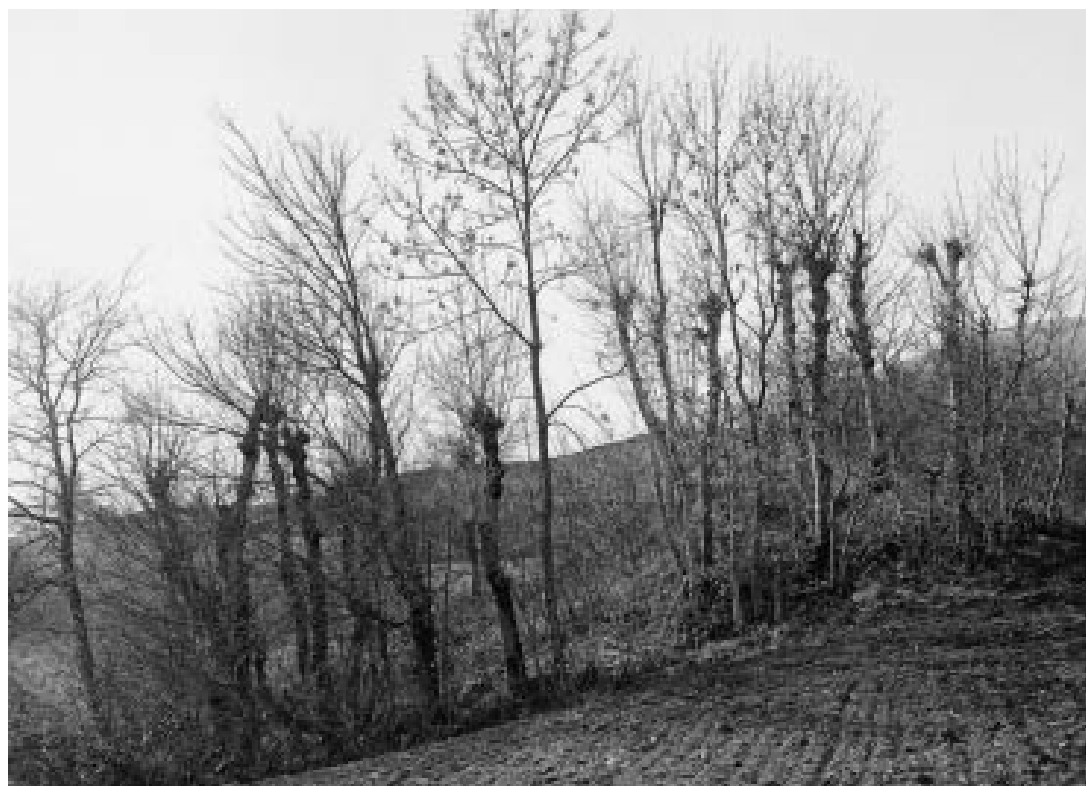
Abbildung 9: «Lesesteinhaufen mit geschneitelten Eschen» 1920 (Villars-Burquin, H. Grossmann, Bildarchiv WSL).