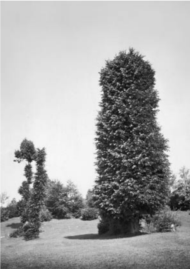
Abbildung 7: «Geschneitete grossblättrige Linde» 1919 (Romont, H. Grossmann, Bildarchiv WSL).