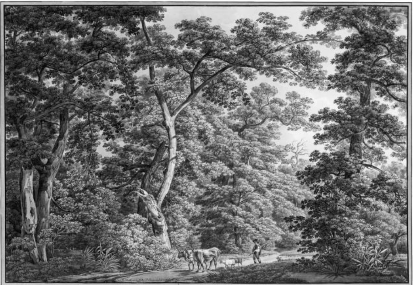
Abbildung 2: Kühe und Schafe im Wald 1812 (in der Hard bei Basel, Peter Birmann, Bleistift, Feder, Öffentliche Kunstsammlung Basel, Kupferstichkabinett).