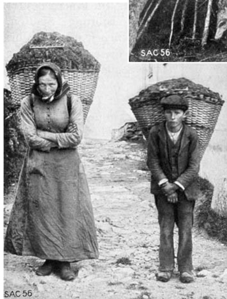
Abbildung 3: Frau und Knabe mit gefüllten Chris-Tschifferen (Eggwald, Zeneggen, STEBLER 1922, S. 98).