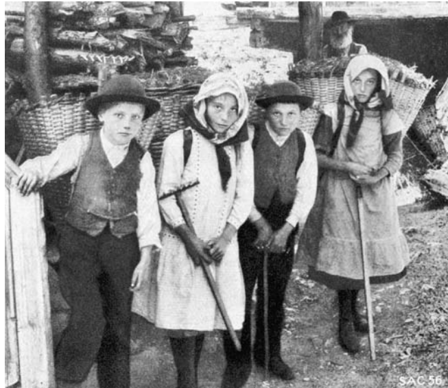
Abbildung 4: Knaben und Mädchen mit gefüllten Chris-Tschifferen (Eggwald, Zeneggen, STEBLER 1922, S. 103).