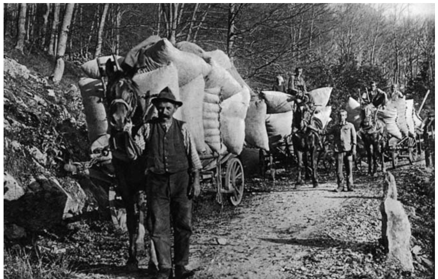
Abbildung 8: Die Buchenlaubernte wird am Abend mit Pferd und Wagen nach Hause geführt (BROCKMANN-JEROSCH 1928/30 I, Abb. 43).

Dass die Bedeutung des Bettlaubs weit über solche gut überlieferten Einzelbeispiele hinaus ging, deuten die folgenden Belege an: Vielerorts bekamen die Schulkinder einen institutionalisierten freien Tag zur Bettlaubgewinnung; 102 der Urner Oberförster propagierte 1890 Holzwolle als Surrogat für Bettlaub; 103 noch im frühen 20. Jahrhundert wurde im Appenzell ein ärmlicher Haushalt mit «Laub onder, Laub ober» bezeichnet; 104 in Zwischbergen (Wallis) existierte mit «Bissagga» eigens ein Wort für den mit Buchenlaub gefüllten und als Schlafunterlage dienenden Sack, 105 im Tessin und im Bergell (Graubünden) benutzte man als Bettunterlage nicht die Blätter der Buchen, sondern «wegen ihrer federkraft» diejenigen der Kastanien. 106 Umgekehrt hielt sich im Saanenland (Berne Oberland) ein minimaler Getreidebau nicht wegen der Körner, sondern wegen des Bettstrohs, 107 und in den Vispertälern (Wallis) herrschte noch 1922 nicht zuletzt deshalb ein Streuemangel, weil das Stroh traditionellerweise zur Füllung der Bettunterlagen verwendet wurde. 108