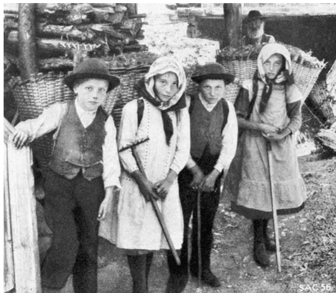
Abbildung 4: Knaben und Mädchen mit gefüllten Chris-Tschifferen (Eggwald, Zeneggen, STEBLER 1922, S. 103).