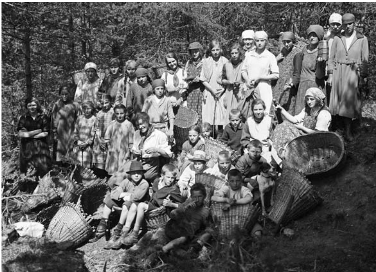
Abbildung 10: Am Vortag von Fronleichnam machen sich Burschen und Mädchen auf den Weg, um mit «Tschiffre» und Körben aus dem Thelwald bei Visp in grossen Mengen «Miesch» zu holen, mit dem dann der Altar geschmückt wird (1922, Christian Fux, Visp – repr. in Fux 1996).