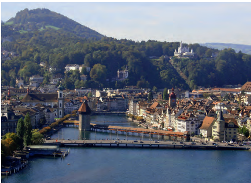
Abb 1 Luzern mit dem «Gütschwald»: Der Waldmeister-Buchen-Wald wäre im Mittelland natürlicherweise die am weitesten verbreitete Waldgesellschaft.

Bei der Eröffnung der Jahresversammlung des Schweizerischen Forstvereins vom 14. bis 17. September 1930 in Luzern beschrieb der damalige Regierungsrat Josef Frey die Situation wie folgt: Wenn der Schweizerische Forstverein sich wieder dazu entschliessen konnte, die diesjährige Versammlung in Luzern abzuhalten, so können wir Luzerner uns dies zur hohen Ehre anrechnen. Dabei sind wir uns allerdings bewusst, dass wir Ihnen, wenn wir die Luzernische Forstwirtschaft als Ganzes ins Auge fassen, keine vorbildlichen oder gar idealen Verhältnisse vorzuzeigen in der Lage sind. Die Forstwirtschaft im Kanton Luzern krankt an einem Übelstand, am allzu starken Vorherrschen des privaten Waldbesitzes und namentlich auch – als Folge dieser Besitzesform, die auf die seinerzeitige Verteilung der Gemeindegüter zurückzuführen ist – an einer starken