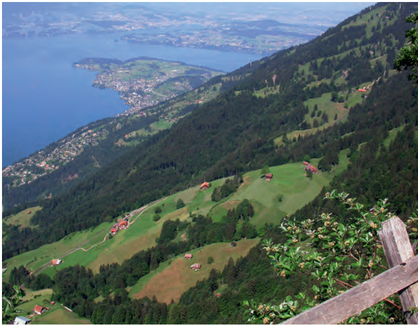
Abb 3 Blick von der Rigi auf Weggis hinunter: Auf kleinem Raum finden sich im Kanton Luzern viele verschiedene Waldgesellschaften.

sechs auf fünf Forstkreise. Es wurden ein überbetriebliches Holzvermittlungssystem (Lenca AG) aufgebaut und regionale Organisationen gebildet. Damit erfolgte eine erneute Verlagerung von Förststellen. Gleichzeitig wurden die Stellen des höheren Forstkaders von ursprünglich 13 (1996) auf heute neun reduziert. Im Sommer 2006 wurden aus den fünf Forstkreisen drei Waldregionen gebildet. Ab Sommer 2008 werden im Kanton voraussichtlich noch 18 Forstreviere bestehen. Beim Staatsforstbetrieb, der 1996 noch aus sechs Betriebsgruppen mit 32 Betriebsmitarbeitern bestand, erfolgte bis 2002 eine Halbierung des Mitarbeiterbestandes (zwei Betriebsgruppen). Heute arbeitet der Staatsforstbetrieb unter einer Führung.