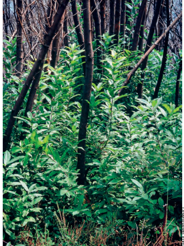
Abb 6 Ausschlagende Kastanien ( Castanea sativa ) nach Waldbrand.

tremereignissen verjüngen, können uns Modellprojektionen geben (siehe Zimmermann & Bugmann 2008, in diesem Heft). Noch unmittelbarer als in solchen schwer interpretierbaren Projektionen zeigt sich jedoch die Wirkung höherer Temperaturen bereits heute zum Beispiel in der Zunahme von immergrünen Pflanzen in Tessiner Wäldern (Walther et al 2002), im Höherwandern der Mistel (Dobbertin et al 2005), in der Ablösung der Waldföhren durch die Flaumeiche im Wallis (Rigling et al 2006) oder in der Invasion von Neophyten auf Blößen in Wäldern tieferer Lagen (Nobis 2008). Auf der Grundlage solcher Beobachtungen können gezielte Experimente zur Baumverjüngung unter limitierten Wuchsbedingungen neue Erkenntnisse liefern. ■