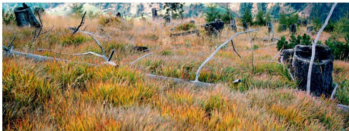
Abb 4 Reitgrasflur in der Waldbrandfläche ob Münstair (Graubünden).

Da bei Waldbränden die Vorverjüngung in der Regel ebenfalls vernichtet wird, dauert die natürliche Verjüngung länger als nach Windwürfen. In trockenen Lagen wie im Wallis ist eine ausreichende Bodenfeuchte im Frühling entscheidend für den Verjüngungserfolg. Folgen einem Waldbrand mehrere trockene Jahre, dann bleibt die spontane Ansiedlung von Waldbäumen für eine längere Zeit aus.