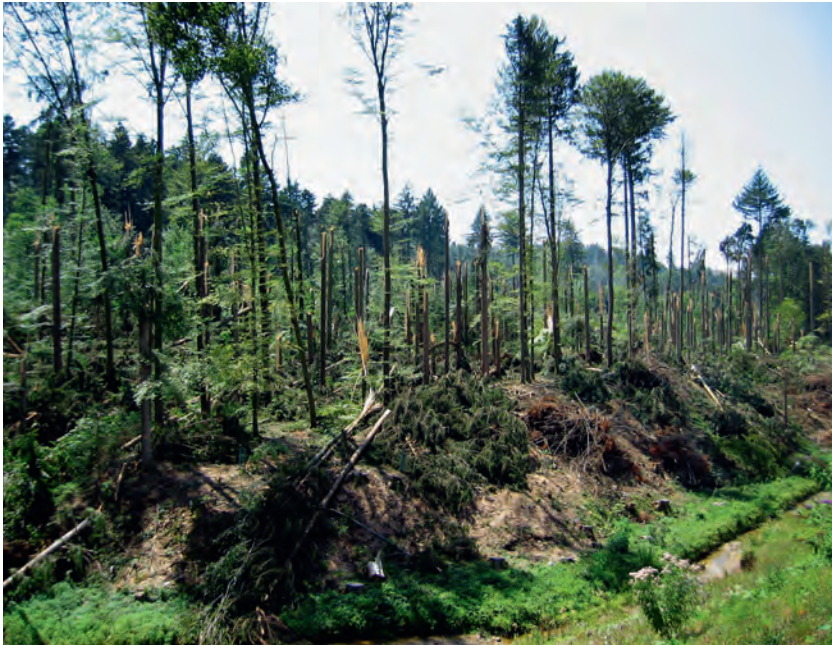
Abb 1 Stammbrüche von Fichten und Buchen nach dem sommerlichen Gewittersturm vom 16. Juli 2003 bei Wangen, Gemeinde Jona (St. Gallen).

ckenperioden während der Sommermonate führen. Die Waldbrandgefahr ist in denjenigen Gebieten am grössten, wo sowohl genügend Niederschläge, die das Wachstum der Vegetation und den Aufbau von Brandgut ermöglichen, als auch vorübergehende Trockenperioden, die dieses Brandgut entzündbar machen, vorhanden sind (Christensen 1993). Bei wärmerem Klima dürften Waldbrände nicht nur auf der Alpensüdseite, wo die Monate Januar bis April während der letzten 30 Jahre trockener geworden sind (Reinhard et al 2005), sondern auch nördlich der Alpen (Schumacher & Bugmann 2006) häufiger werden. Im trocken-heissen Sommer 2003 nahm beispielsweise die Blitzschlaganfälligkeit der Vegetation in den montanen und subalpinen Lagen der (Tessiner) Alpen zu, was das Waldbrandrisiko erhöhte (Conedera et al 2006). Im dicht besiedelten Europa, also auch in der Schweiz, haben Waldbrände aber zu über 90% eine unnatürliche Ursache wie Unachtsamkeit an Feuerstellen oder Brandstiftung (Conedera et al 2006). Die Feuerausbreitung verschärft sich überdies bei Starkwinden, so zum Beispiel während Föhn. Die hier geschilderten Prognosen von Extremereignissen sind allerdings generell mit grossen Unsicherheiten behaftet.