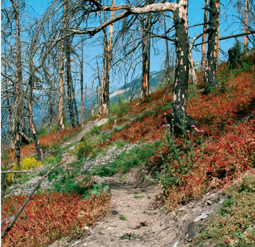
Abb 5 Waldbrandfläche von Leuk (Wallis) drei Jahre nach dem Brandereignis vom 13. August 2003 mit Erdbeerspinat ( Blitum virgatum L.). In den trockenen Tieflagen kommt die Verjüngung von Baumarten nur schleppend voran.