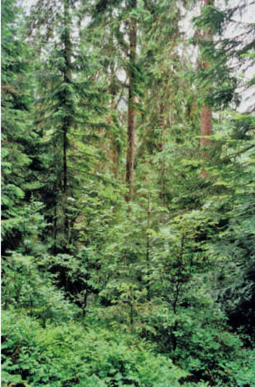
Abb 3 Für eine finanziell vorteilhafte ungleichaltrige Bewirtschaftung kommt nur ein bestimmtes Baumartenspektrum infrage.

Fichte beträgt fast 2 EUR/J, während der Zins des Bankkontos nur 0.87 EUR/J ausmacht. Natürlich müssen wir einschränkend erwähnen, dass diese Betrachtung etwaige Auswirkungen des Belassens der Fichte auf ihre Nachbarn und auch Risiken vernachlässigt (wobei auch die Geldanlage bei der Bank nicht ganz risikofrei ist). Prinzipiell könnte man diese Aspekte jedoch berücksichtigen. Auch dann würde klar werden, dass eine schematische Ernte aller Bäume zu ein und demselben Zeitpunkt (Kahlschlag) für viele Bäume suboptimal wäre, weil der Erntezeitpunkt entweder zu früh (entgangener Wertzuwachs) oder zu spät (Verluste durch Entgang alternativer Investitionsmöglichkeiten) ist.