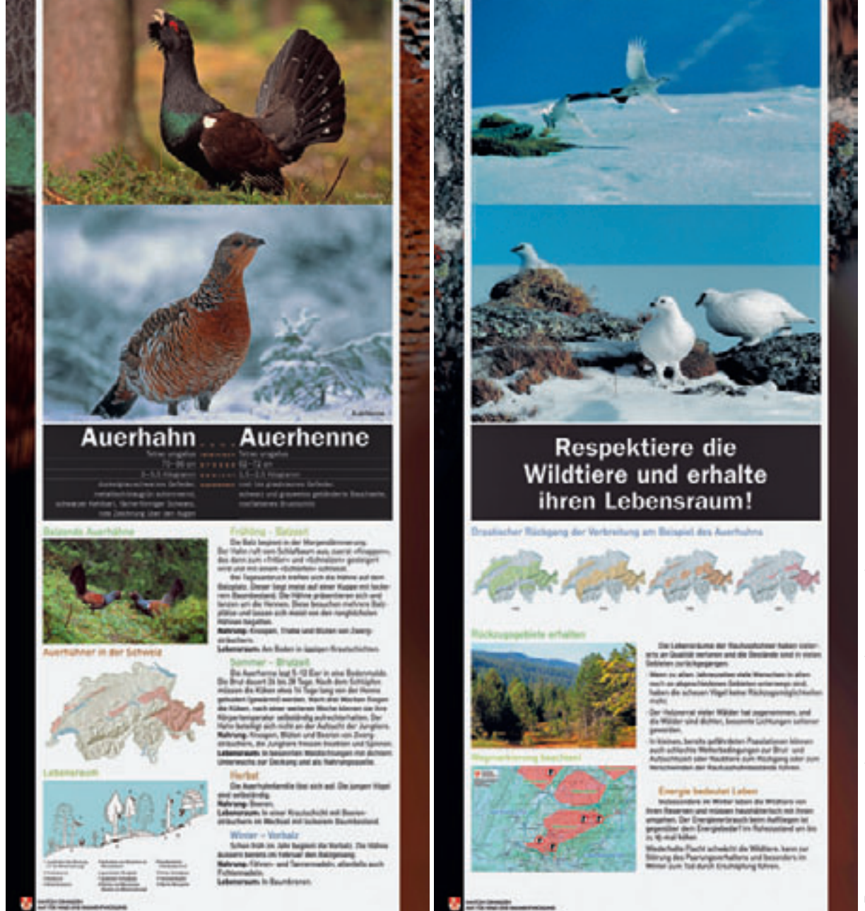
Abb 4 Informations- tafeln «Auerhuhn» und «Respektiere die Wild- tiere und erhalte ihren Lebensraum», die beim Kanton Obwalden ausgeliehen werden können.

jagdlichen Ausstellung Informationstafeln zu allen Raufusshühnern, zu ihren Lebensraumansprüchen und ihrer Verbreitung im Kanton Obwalden (Abbildung 4). Auch verfassten wir für jede Raufusshuhnart ein umfassendes Informationsblatt. Diese Materialien sind vielfältig einsetzbar und stehen allen zur Verfügung. 1 Da das Auerhuhn eine national geschützte und sehr störungsempfindliche Art ist, behandeln wir Informationen zum Verbreitungsgebiet, zu Standorten indirekter Nachweise, zu Feldbeobachtungen oder zur Lage von Balzplätzen als sensible Daten, die wir nicht bekanntgeben.