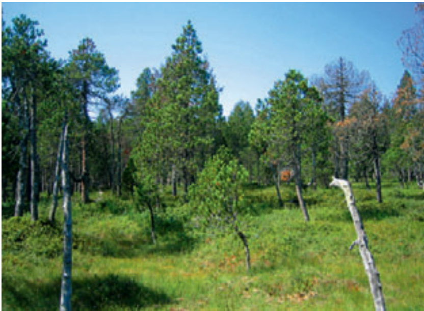
Abb 1 Vielfältige Bestandsstrukturen und offene Flächen in einem Auerhuhnlebensraum im Kanton Obwalden.