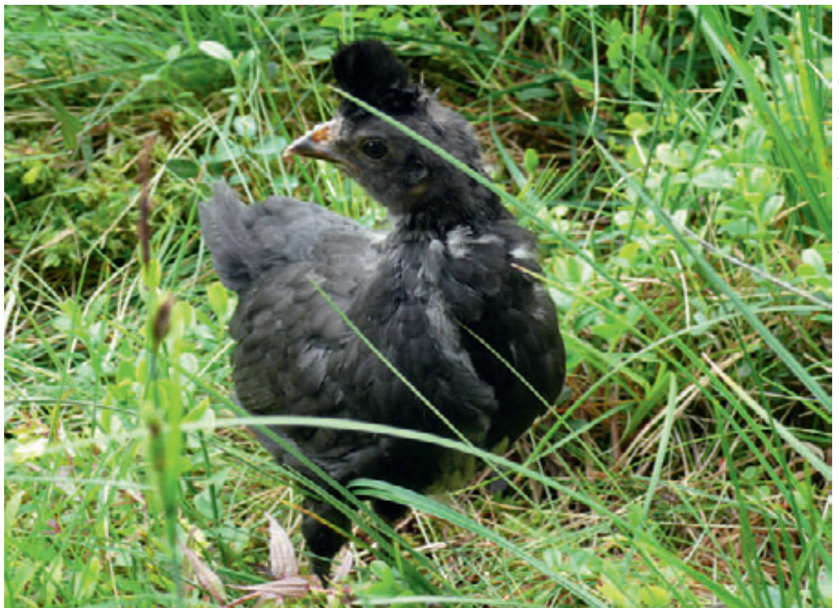
Abb 1 Neunzehn Tage altes Appenzeller Spitzhaubenküken im Testfeld «Mischtyp».

Die Beobachtungssequenzen der Küken fanden zwischen dem 17. Juni und dem 11. Juli 2009 statt. An insgesamt 15 Tagen führten wir die Versuche durch. Dabei setzten wir die Küken an jedem Tag jedem Vegetationstyp mindestens einmal aus.