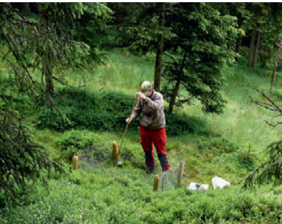
Abb 2 Messung der an der Vegetation haftenden Wassermenge mit saugfähigem Papier, das an einem Holzstab befestigt war.

Die Reihenfolge der Vegetationstypen variierten wir von Tag zu Tag. Wir führten die Versuche mit den Küken nur durch, wenn es nicht regnete. Insgesamt resultierte eine Stichprobe von 91 Beobachtungssequenzen und Wassermengennmessungen. Jede Beobachtungssequenz und jede Wassermengennmessung betrachteten wir in der Auswertung als unabhängiges Ereignis.