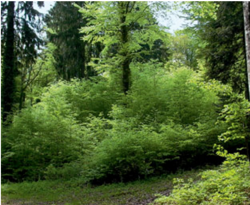
Fig. 2 Irrégularisation de la hêtraie par la coupe en mosaïque. Ici, les forêts communales de Gorgier (NE), division 12.