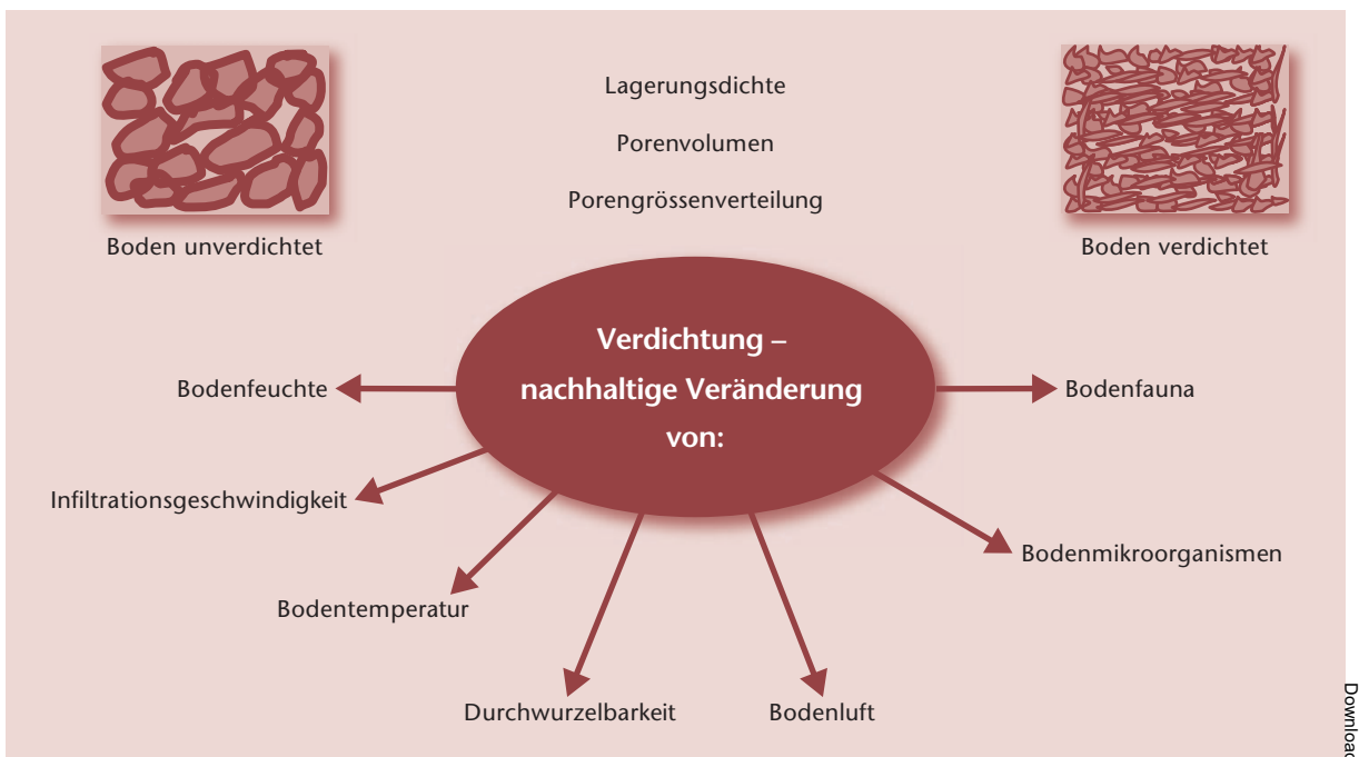
Abb 1 Wirkung nachhaltiger Bodenverdichtungen in Waldböden. Kenngrößen des Bodenlufthaushaltes und biologische Parameter (Durchwurzelbarkeit, mikrobiologische Parameter) sind ebenso wichtig für die Charakterisierung von Bodenstrukturstörungen wie bodenphysikalische Parameter (Lagerungsdichte, Porenvolumen).

mit die bodenschonende Holzernte, ein wichtiger Aspekt der Waldbewirtschaftung. Das Befahren mit Forstmaschinen führt auf einem Grossteil der Schweizer Waldböden im Bereich der Fahrspuren zu tiefgreifenden und lang anhaltenden Bodenveränderungen. Die Transportleistung des Bodens für Wasser und Luft wird eingeschränkt, womit wichtige Bodenfunktionen beeinträchtigt werden (Frey et al 2009, Kremer et al 2009). Der Schutz unserer Waldböden ist wichtig, weil bereits entstandene Beeinträchtigungen nur mit grossem Aufwand zu beheben sind.