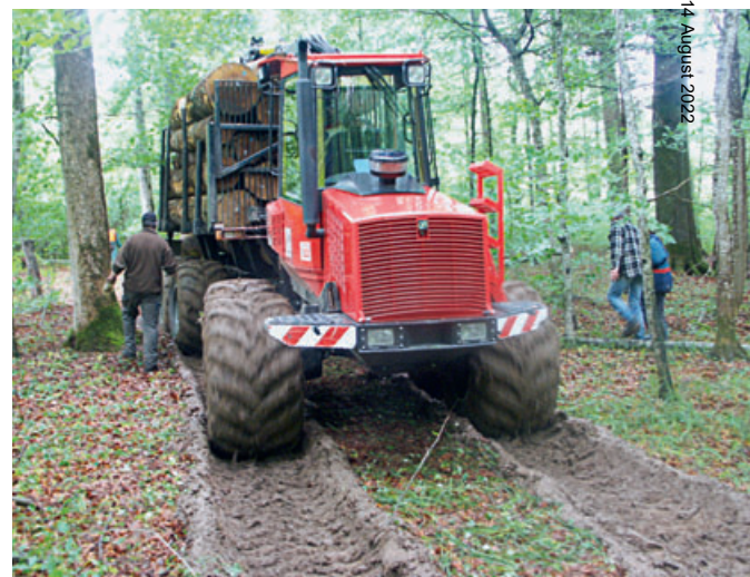
Abb 2 Fahrversuche in Ermatingen (Kanton Thurgau): Durch das gezielte Anlegen von Fahrspuren in einem kontinuierlich ansteigenden Bodenfeuchtegradienten konnte eine stetig zunehmende Deformation der Bodenstruktur erzeugt werden.

Intensive Wechselwirkungen zwischen biologischen, chemischen und physikalischen Prozessen nach physikalischen Bodenbeeinträchtigungen finden im Boden unter anderem über den Gashaushalt statt. Intakter Boden besteht je zur Hälfte aus fester Substanz und aus luft- oder wasserführenden Poren. Ein beschädigtes und eingeschränktes Porensystem verringert die Transportleistung für Wasser und Luft. Die Feinporen sind häufiger mit Wasser gefüllt. Weil Sauerstoff zehntausendmal langsamer in Wasser als in Luft diffundiert, wird Sauerstoff im Porenraum viel langsamer nachgeliefert. Der Gasaustausch zwischen Boden und Atmosphäre ist in einem verdichteten Boden, beispielsweise in Fahrspuren, gestört. Dadurch werden bei gegebenen Klima- und Feuchtigkeitsbedingungen der Luft- und Wasserhaushalt im Boden und damit die Lebensbedingungen der Mikroorganismen in Bezug auf O 2 - beziehungsweise