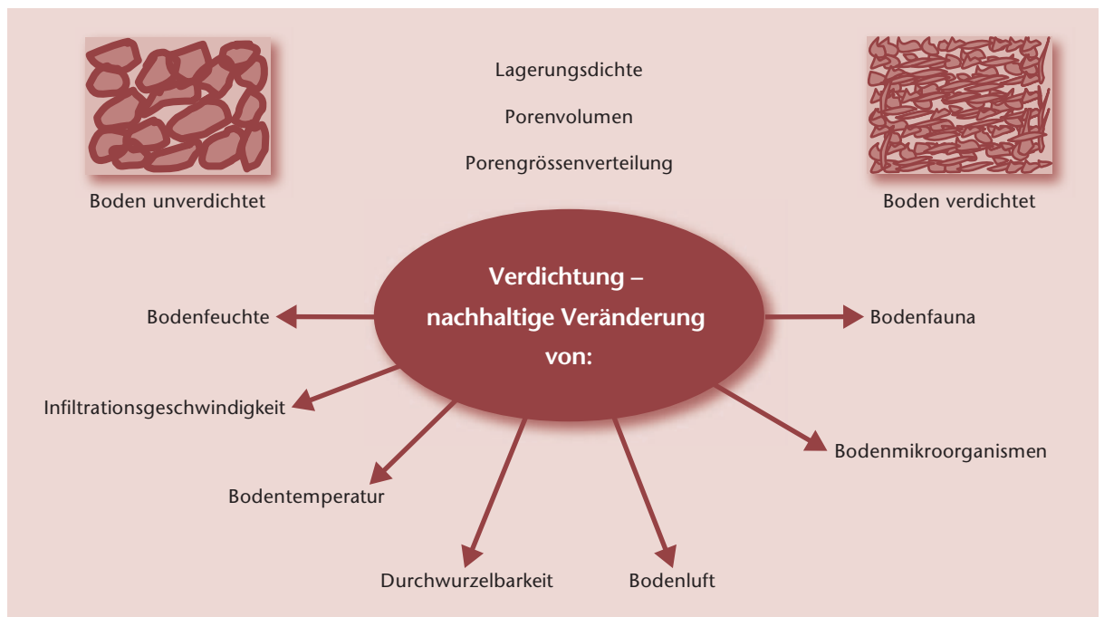
Abb 1 Wirkung nachhaltiger Bodenverdichtungen in Waldböden. Kenngrößen des Bodenlufthaushaltes und biologische Parameter (Durchwurzelbarkeit, mikrobiologische Parameter) sind ebenso wichtig für die Charakterisierung von Bodenstrukturstörungen wie bodenphysikalische Parameter (Lagerungsdichte, Porenvolumen).

mit die bodenschonende Holzernte, ein wichtiger Aspekt der Waldbewirtschaftung. Das Befahren mit Forstmaschinen führt auf einem Grossteil der Schweizer Waldböden im Bereich der Fahrspuren zu tiefgreifenden und lang anhaltenden Bodenveränderungen. Die Transportleistung des Bodens für Wasser und Luft wird eingeschränkt, womit wichtige Bodenfunktionen beeinträchtigt werden (Frey et al 2009, Kremer et al 2009). Der Schutz unserer Waldböden ist wichtig, weil bereits entstandene Beeinträchtigungen nur mit grossem Aufwand zu beheben sind.