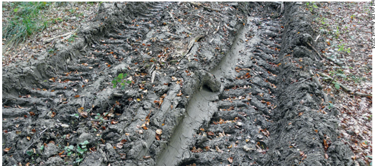
Abb 1 Eine Befahrung von Waldböden mit Forstmaschinen kann im Bereich der Fahrspuren zu tief greifenden und lang anhaltenden Veränderungen im Boden führen, die von aussen nicht sichtbar sind.

Mit Befahrungsexperimenten im Forst (Heiteren) bei Bern im schweizerischen Mittelland – der Standort gehört zum Waldmeister-Buchenwald (Ehlenberg & Klötzli 1972) – wurde versucht, die auf