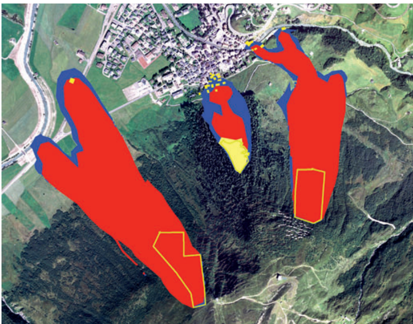
Abb 1 Berechnete Lawinauslaufzonen für ein 300-jähriges Lawineneignis in der Gemeinde Andermatt. Rot und blau: rote und blaue Lawinengefahrenzonen; gelbe Fläche: fiktive Windwurffläche; gelb gerahmt: potenzielle Lawinenanrissgebiete.

stark ein Attribut gewichtet wird, wurden in sogenannten Choice-Sets verschiedene Attributlevel mit jeweils drei Optionen kombiniert (Tabelle 2).