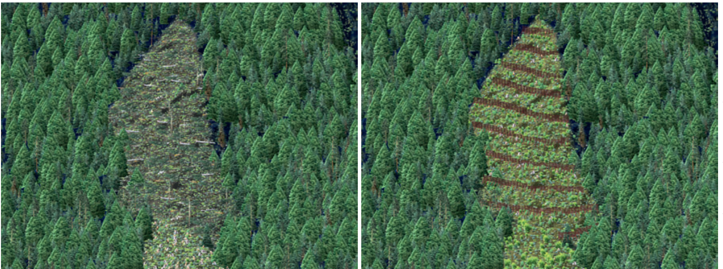
Abb 3 Nahaufnahme der Windwurffläche. Links: direkt nach dem Windwurf, rechts: Zustand nach etwa 10 bis 15 Jahren mit Stahlbrücken.

Visualisierungen gearbeitet. Neuere Studien haben gezeigt, dass die Anwendung von Visualisierungen bei Choice-Experimenten die Variabilität der Präferenzen und die Asymmetrie der Antworten zwischen der Frage nach der Zahlungsbereitschaft und einer entsprechenden Kompensationsforderung signifikant reduziert (Bateman et al 2009).