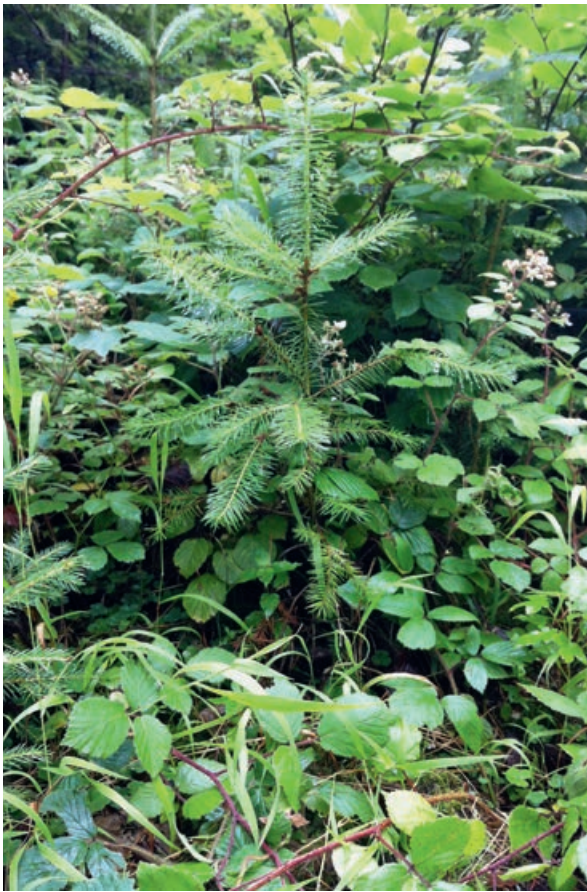
Abb 2 Natürliche Verjüngung der Douglasie bei Dintikon (AG).