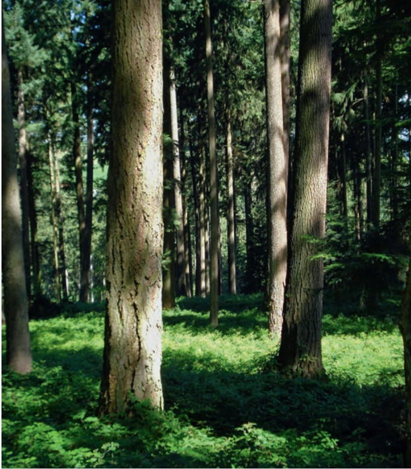
Abb 3 Nadelbaum-Hochwald mit Douglasie bei Willisau (LU).

gung in der Schweiz, dass Forstleute die Entwicklung zu vermehrtem Douglasienanbau positiv bewerten, während Personen aus dem Naturschutz diese eher negativ einschätzen und einen begrenzten Anbau, ausschliesslich in Mischbeständen fordern.