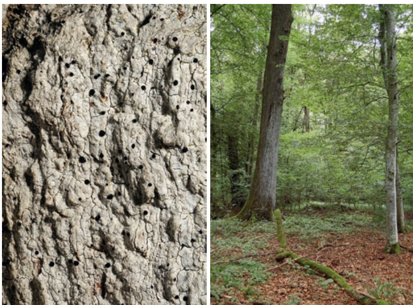
Abb 4 Die Eichenstabflechte ( Bactrospora dryina ; links) kann sich erst an über 90-jährigen Eichen (rechts) etablieren.