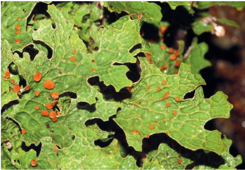
Abb 3 Die Echte Lungenflechte ( Lobaria pulmonaria ) weist in Europa ein grosses Verbreitungsgebiet auf, ist aber in bewirtschafteten Wäldern selten geworden.

den, oder durch spezialisierte, nur Bruchteile eines Millimeters grosse vegetative Ausbreitungseinheiten. Die körnig-mehligen vegetativen Ausbreitungseinheiten von Flechten (Soredien) sind deutlich grösser als Sporen und verfügen dadurch über ein stark eingeschränktes Ausbreitungsspektrum, was das gegenwärtige Verbreitungsmuster von zahlreichen baumbewohnenden Flechtenarten zu beeinflussen scheint (Dettki et al 2000, Sillett et al 2000).