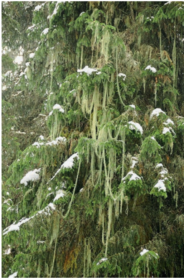
Abb 2 Flechtenwald mit der Engelshaarflechte ( Usnea longissima ) bei Muotathal.

und Calicium , aber auch die Eichen-Stabflechte ( Bactrospora dryina ) und die Feinfaserige Fleckflechte ( Arthonia byssacea ) genannt werden. Mit ihren hydrophoben Lagern nehmen sie Wasser nur in Form von hoher Luftfeuchtigkeit auf und wachsen nur an regengeschützten Kleinstandorten wie überhängende Stammseiten oder Borkenrisse.