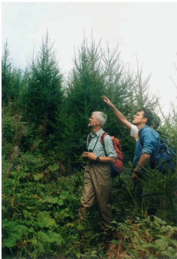
Fig. 2 Pro Noyet, surface ravagée par Vivian en 1990. Rajeunissement naturel du mélèze de plus de 2 m de hauteur en 2001. La surface a fait l'objet d'un projet de recherche suivi par le WSL et subventionné par l'OFEFP (actuellement OFEV).