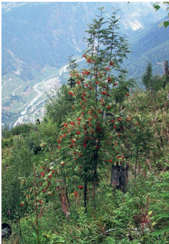
Fig. 3 Pro Noyet, surface ravagée par Vivian en 1990, avec rajeunissement du sorbier des oiseleurs en 2002.