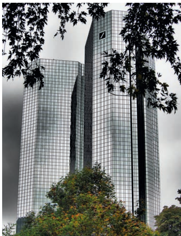
Abb 4 Urbane Grünflächen können zur Verbesserung des Mikroklimas beitragen.