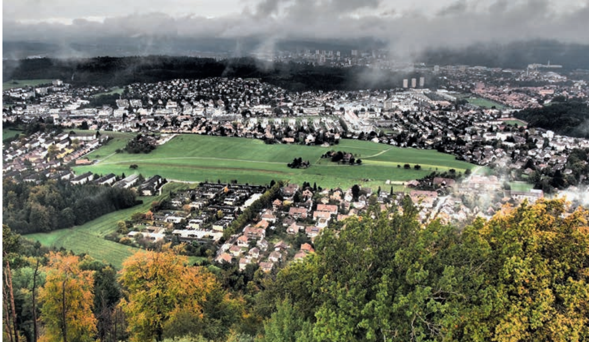
Abb 2 Urban Forestry betrifft sämtliche urbanen Frei- und Grünflächen im Siedlungsbereich mit Holzgewächsen – von Wäldern, Baumgruppen und Einzelbäumen über private und öffentliche Parks und Gärten bis hin zu Friedhöfen, Spielplätzen, Sport- und Freizeitanlagen.

1997, Konijnendijk et al 2000, 2005, 2006, Konijnendijk 2003), die zeigen, dass sich Urban Forestry als Thema, Disziplin und Wissensgemeinschaft weltweit etabliert hat. Mit einem Teilaspekt von Urban Forestry befasst sich die laufende COST Action FP1204 «Green Infrastructure approach: linking environmental with social aspects in studying and managing urban forests». 5