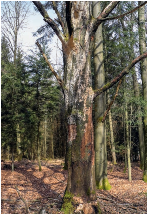
Abb 2 Aktives Totholzmanagement: Buche vier Jahre nach dem Ringeln.

der anzureichern: ökologisch effizient im Sinne einer möglichst schnellen und umfassenden Verbesserung der natürlichen Biodiversität, ökonomisch effizient im Sinne einer möglichst kostengünstigen Bereitstellung bzw. alternativer Erträge (z.B. Vertragsnaturschutz) und auch effizient im Sinne der Betriebssicherheit (Klimawandelfolgen, Arbeitssicherheit, Verkehrssicherung, Arbeitsergonomie etc.). Der Umgang mit Totholz ist im Waldbetrieb Eichelberg im dazu entwickelten Konzept «BioHolz» umfassend geregelt. Aktuelle Praxiserfahrungen und neu gewonnene wissenschaftliche Erkenntnisse werden laufend integriert.