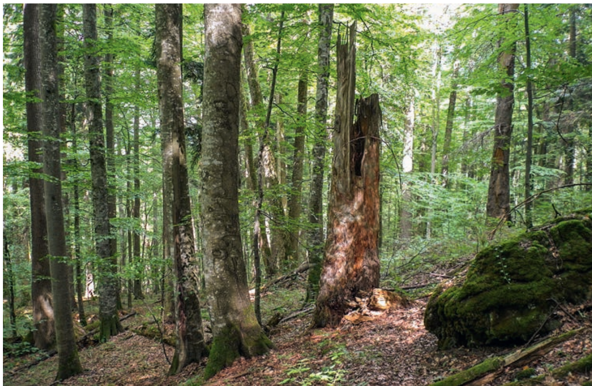
Abb 1 Buchen-Edellaubholz-Tannen-Urwald in den Karpaten.

Neben der skizzierten, umfangreichen biophysikalischen Erforschung der Mechanismen der Totholzentwicklung findet sich nur wenig zum Management von Totholz. Meyer (1999) hat ein Totholzmodul für das Entscheidungsunterstützungssystem «Der WaldPlaner» vorgestellt, welches die Auswirkungen von Managemententscheidungen auf die Totholzentwicklung darstellen kann. Ein Modell, das es erlaubt, die kostengünstigste Strategie zur Erreichung von bestimmten Totholzzielen zu ermitteln, fehlt dagegen bis jetzt. Diese Lücke kann mit modernen Optimierungsansätzen geschlossen werden. Ein solcher Ansatz soll vorliegend erläutert werden.