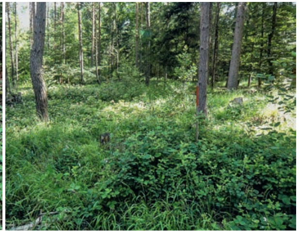
Abb 1 Ein solch grosses Nest direkt am Wegrand wie im linken Bild wird unmöglich übersehen. Dagegen wird das kleine, durch Vegetation überdeckte Nest im rechten Bild nur bei genauem Hinschauen entdeckt (das Nest befindet sich beim roten Markierungspfahl).

Grossbritannien (Procter et al 2015). Eine schweizweite Habitatstudie der Waldameisen wurde ausserdem von Vandegehuchte et al (2017) durchgeführt.