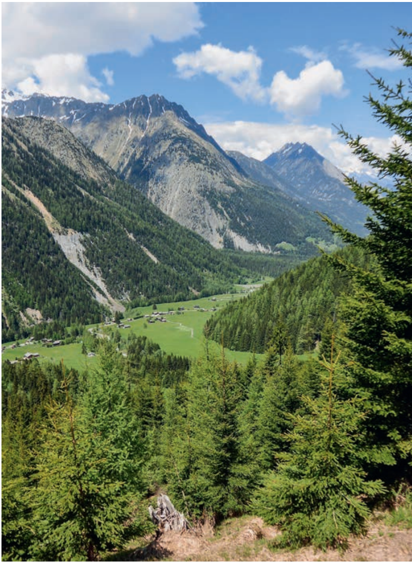
Fig. 1 La forêt remplit plusieurs fonctions sur les plans environnemental, social et productif. Elle protège notamment les habitations et les infrastructures contre les dangers naturels.