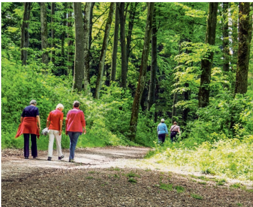
Fig. 3 La fonction de loisirs et de détente de la forêt est très appréciée par la population SUISSE.

que la disposition à payer est plus élevée chez la population citadine que parmi la population rurale. Une enquête menée dans le canton de Genève a montré que les Genevois étaient prêts à payer davantage pour les réserves forestières de toute la Suisse que pour celles situées sur leur propre territoire cantonal, ce qui justifie un cofinancement des réserves par la Confédération (Borzykowski et al 2018).