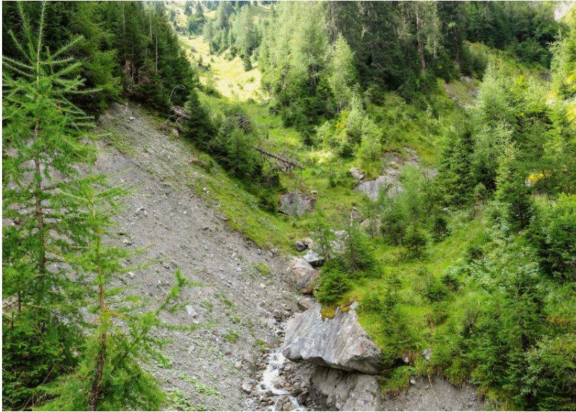
Abb 2 Rutschung in einen murgangfähigen Bach mit obenliegendem, stabilisierendem Schutzwald (Drostobel, Klosters, GR).

ten modelliert. Der Prozess «Rutschungen» umfasste dabei Hangmuren und flachgründige Rutschungen. Nicht berücksichtigt wurden permanente mittel- und tiefgründige Rutschungen, weil der Einfluss des Waldzustandes auf diese Prozesse limitiert ist. Für die Modellierung der Rutschungen wurden die in Tabelle 1 aufgeführten Datengrundlagen verwendet (detaillierte Informationen sind in Losey & Wehrli 2013, Anhang 1, zu finden).