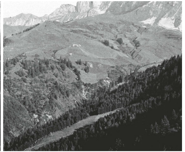
Abb 1 Einzugsgebiet des Gangbachs im Schächental (UR) im Jahr 1911 mit vielen offenen Rutschflächen (links) und 1982 mit deutlich höherem Waldanteil und stabileren Einhängen (rechts).

werke wie Schutzbauten geschaffen. Die fachliche und politische Auseinandersetzung mit dem Thema führten schliesslich zu den Bundesgesetzen über die Forstpolizei (1876) und über die Wasserbaupolizei (1877; Schweizerischer Bundesrat 2016). 1886 stellte Elias Landolt in einer vom Schweizerischen Forstverein herausgegebenen Publikation fest, dass zur Verminderung von Hochwasserschäden in den letzten 30 Jahren an den grösseren Gewässern viel getan worden war, dass aber, sollten die Schutzbauten an diesen Flüssen ihre Aufgabe dauernd erfüllen, auch die geschiebeführenden Zubringerbäche in einen Zustand gebracht werden müssen, der den Geschiebeeintrag vermindert (Abbildung 1). Als Massnahmen dafür schlug er nebst technischen Verbauungen auch biologische Massnahmen wie Aufforstungen und Begrünungen in Gewässereinhängen vor (Landolt 1886). Die Schutzwirkung des Waldes bei Gerinneprozessen wurde damit früh erkannt. Allerdings erfolgte erst mit der harmonisierten Schutzwaldausscheidung gemäss SilvaProtect 2011 eine konsequente Berücksichtigung der indirekten Prozesse (Losey & Wehrli 2013).